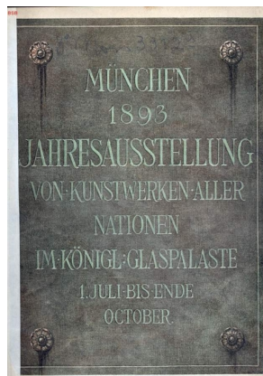
Titelblad fra det illustrerede katalog til den internationale udstilling i München, 1893.